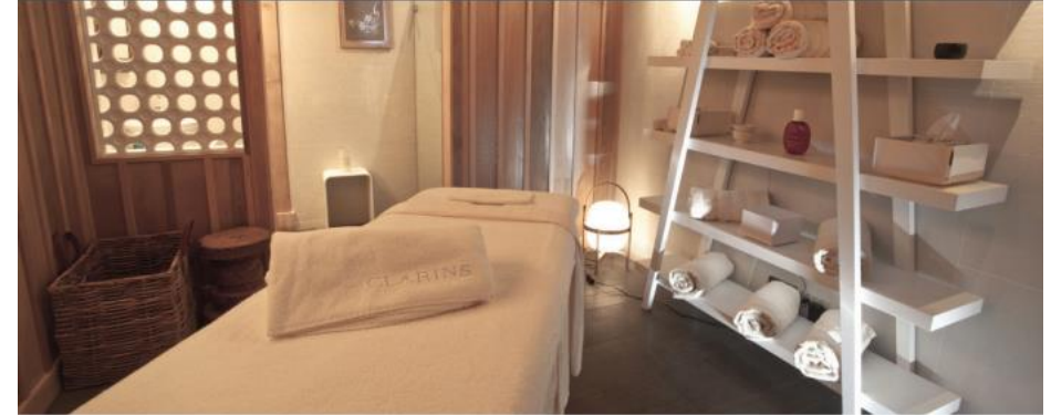
Mains, Pieds & Epilations Hands, Feet & Waxing

Cours individuel sur demande – Reserve your private class – 1h / 100€