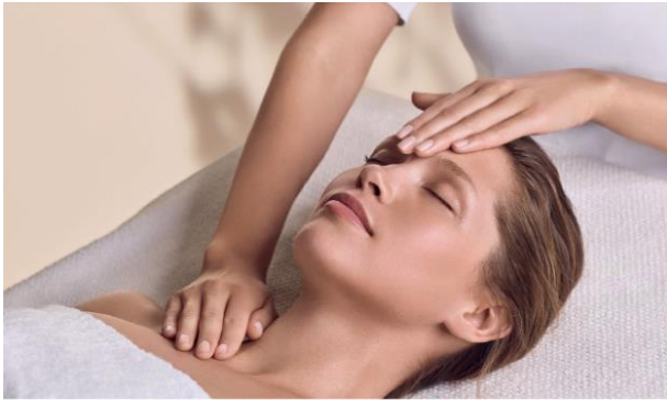
Les Soins Experts Sur Mesure Bespoke Skin Expert Treatments