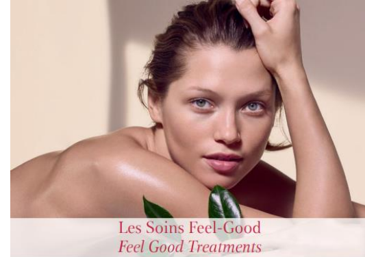
Les Soins Feel-Good Feel Good Treatments