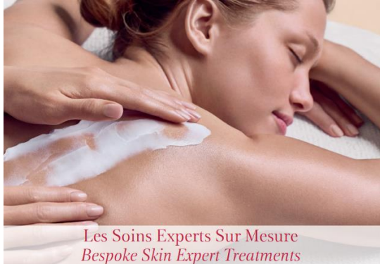
Les Soins Experts Sur Mesure Bespoke Skin Expert Treatments