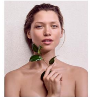
Les Soins Experts Sur Mesure Bespoke Skin Expert Treatments

This detoxifying treatment is the perfect ally of combination or oily skin that needs to be rebalanced. Impurities are gently removed; skin shine is reduced and pores are tightened. Your skin looks clear, fresh and healthy.